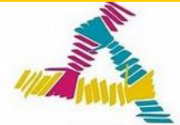
2011: Año Europeo del Voluntariado